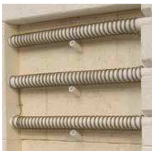
Typ XT -spirály uloženy na nosných trubkách