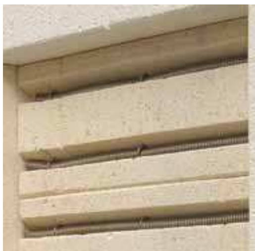
Typ XR – spirály uloženy v drážkách